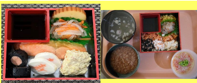
ソフトB食 (歯ぐきでつぶせるやわらかさ)

☆噛むことが難しい方には、 このように細かく刻んで食 べやすくしたり、ムース状 のお食事を提供しています。