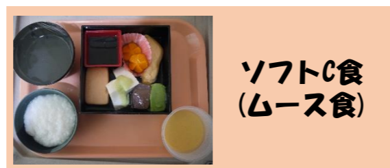
ソフトC食 (ムース食)