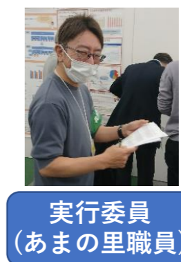
実行委員 (あまの里職員)